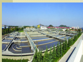
濟南水質淨化二廠 設計規模20萬噸/日 總投資約人民幣2億元