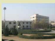
淄博污水處理項目南北廠 設計規模25萬噸/日 總投資約人民幣3.54億元 (包括更新改造工程支出 人民幣1.3億元)