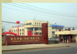
濟南水質淨化一廠 設計規模22萬噸/日 總投資約人民幣2.2億元