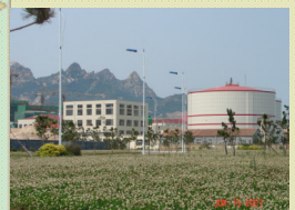
青島麥島污水處理項目 設計規模14萬噸/日 總投資約人民幣2.44億元