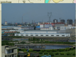
淄博高新區污水處理項目 設計規模10萬噸/日 總投資約人民幣1.5億元