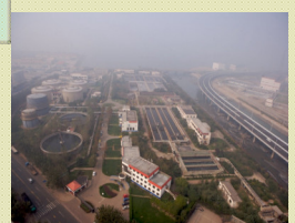
青島海泊河污水處理項目 設計規模8萬噸/日 總投資約人民幣1.1億元