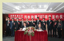
濱州博興污水處理項目 設計規模6萬噸/日 總投資約人民幣0.8億元