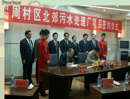
淄博周村區北部污水處理項目 設計規模4萬噸/日 總投資約人民幣0.8億元